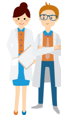
Pflegefachfrau / Pflegefachmann

Die Ausbildung verbindet Theorie und Praxis auf ideale Weise: Im Unterricht an der Pflegeschule erwerben die Auszubildenden die theoretischen und fachpraktischen Kompetenzen, die sie in den Praxiseinsätzen – im Ausbildungsbetrieb und in weiteren Einrichtungen – direkt anwenden können. Von der stationären Langzeit- und Akutpflege bis zur ambulanten Pflege erleben sie hautnah, wie vielseitig und anspruchsvoll der Pflegeberuf ist.